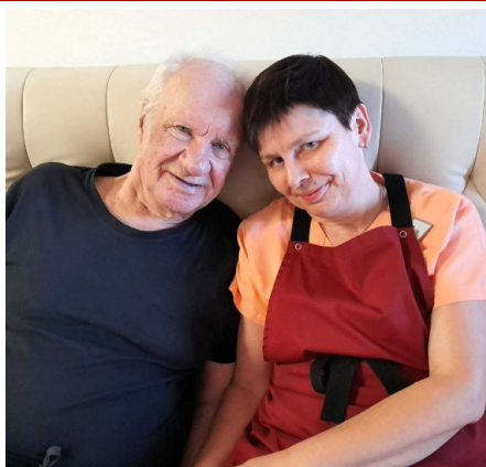
ZPRÁVY Z DOMOVA